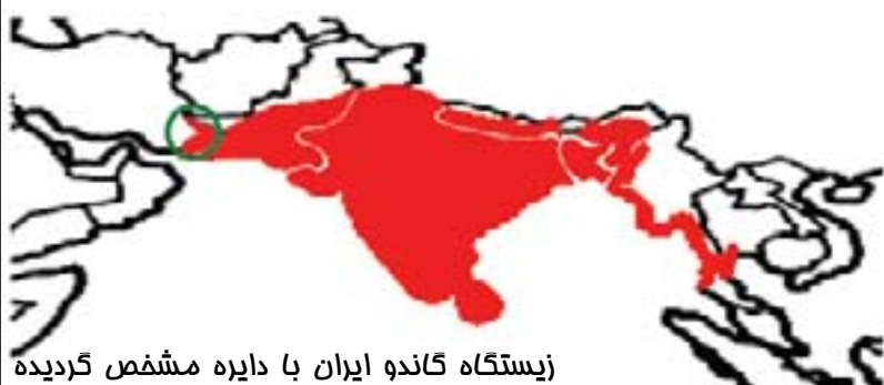
زیستگاه گاندو ایران با دایره مشخص گردیده

مناطق زیستگاهی و پراکنش C rocodylus palustris شامل: هند، سریلانکا، نپال، بنگلادش، بفتی از هندوچین، پاکستان و از جمله بفتی از جنوب شرقی ایران دیده می شود.