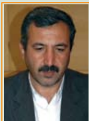
مهندس جلال محمود زاده نماینده مردم مهاباد و عضو هیات ریسه کمیسیون کشاورزی